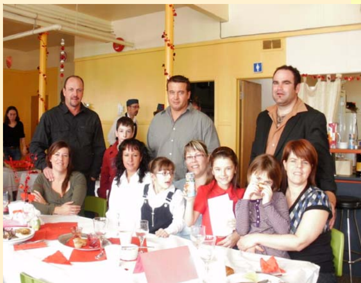
Les membres du comité des loisirs étaient de la partie.