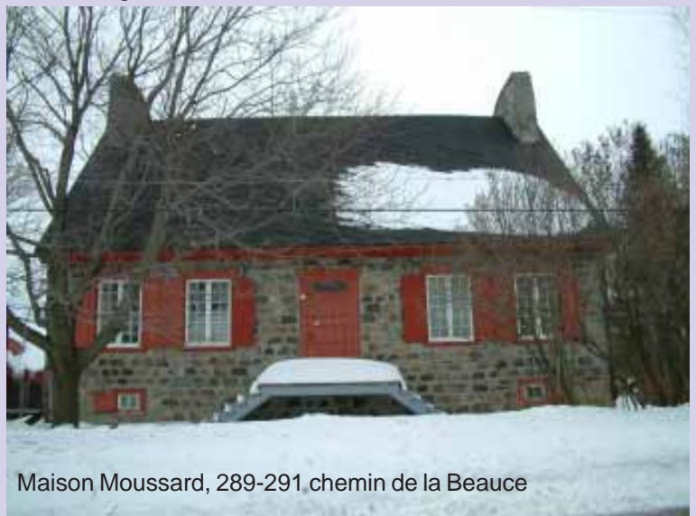
Maison Moussard, 289-291 chemin de la Beauce