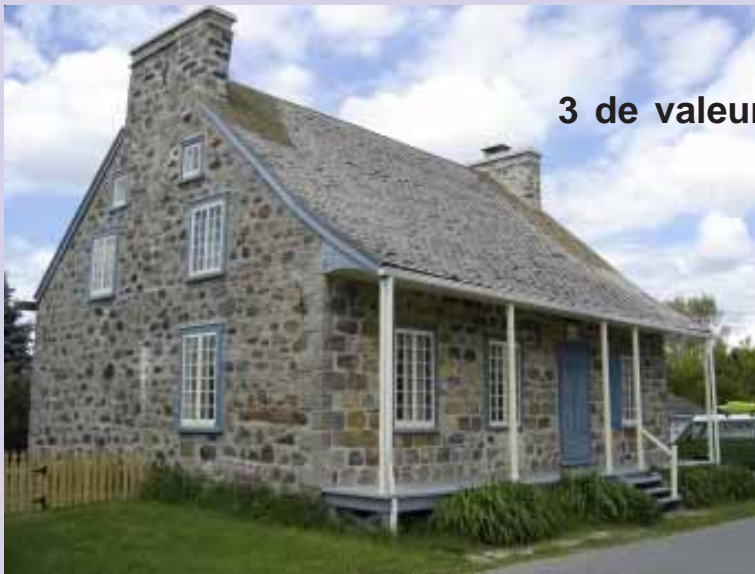
Maison Léonard, 216 chemin de la Beauce