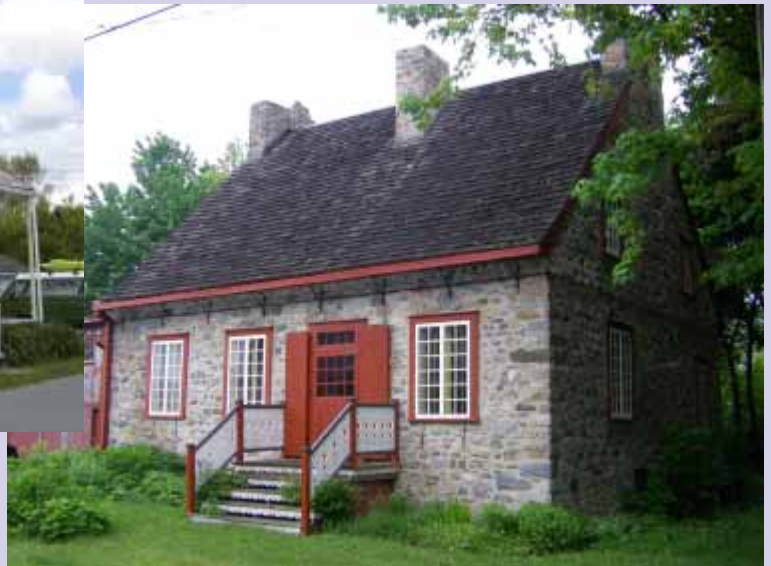
Maison Bégin ou Guillemain-Grenier, 7465 chemin de la Beauce