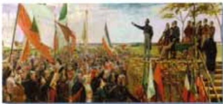
Musée d'archéologie et d'histoire de Montréal

« Ensuite, renchérit-il, on est entré dans une phase où on a voulu fusionner les villages et les paroisses, notamment parce que la distinction entre les deux allait de plus en plus s'atténuer du fait que le village, qui est un noyau urbain, allait commencer à s'étendre à l'intérieur de la paroisse ». ■