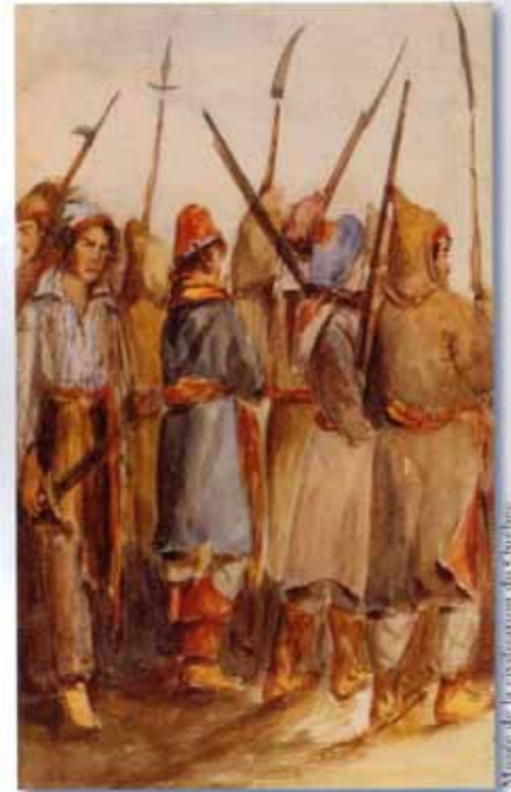
Musée de la civilisation du Québec

« Cela correspond à une scission qui traduisait le fait que les gens collés autour de l'église, du presbytère, du notaire ou du marchand général, étaient dans un